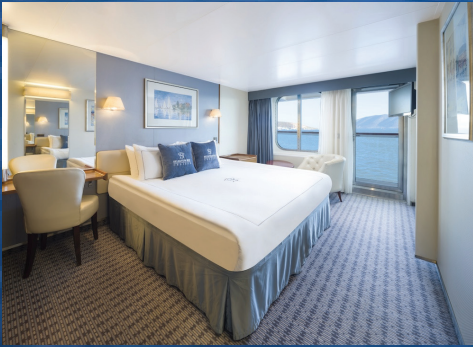
Balkonlu Superior Kabin