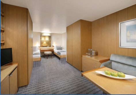
Standart İç Kabin