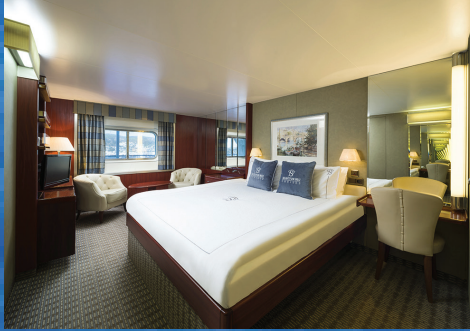
Standart Dış Kabin