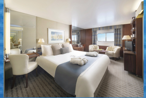
Superior Dış Kabin