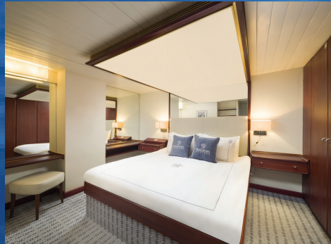
Balkonlu Royal Suit